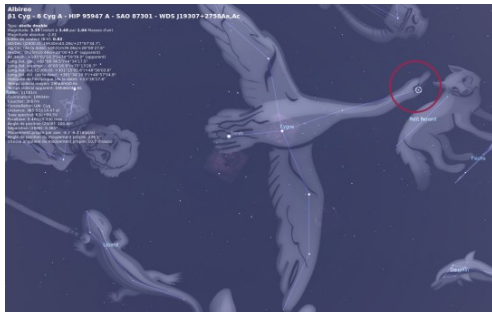
La constellation du Cygne dont la tête est positionnée sur l'étoile Albiréo

Cassiopée ailée en robe de plumes dans la cascade, puis la représentation symbolique de la triplicativité des âmes dans les lames du plancher.