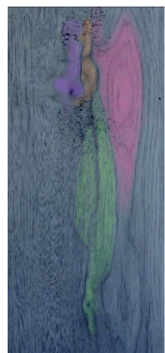
Image colorée pour différencier les personnages