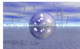
Un "OVNI" en 6 e densité, constitué d'une bulle plasmatisque "entourant et protégeant" une vingtaine d'entités esprits ou groupe de conscience. (photo montage)

Leur conscience possède ainsi la faculté de s'introduire et de s'extraire librement de leur corps synthétique. De la même façon qu'ils peuvent quitter leur organisme, puis leurs vaisseaux bio-synthétiques à volonté, ils peuvent également manœuvrer, penser, communiquer, voyager et exister sans les utiliser.