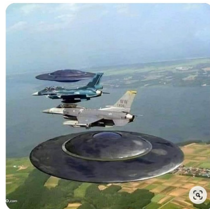
Avions de chasse accompagnés de deux TR3-A

Alors pour commencer à appréhender le phénomène OVNI à partir d'une perspective supérieure, nous avons posé nos questions à l'Ange.