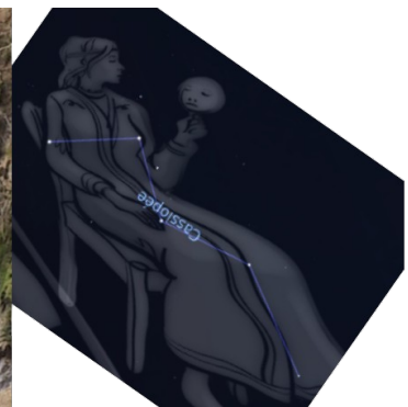
Détail de la photo de gauche, et représentation de la constellation de Cassiopée

La lame du plancher de l'ÉCOLEO sur laquelle se dévoile la "triplicativité de l'âme" représentée par trois personnages imbriqués – celui de droite étant ailé. Le cygne se dessine dans leur prolongement en bas de l'image.