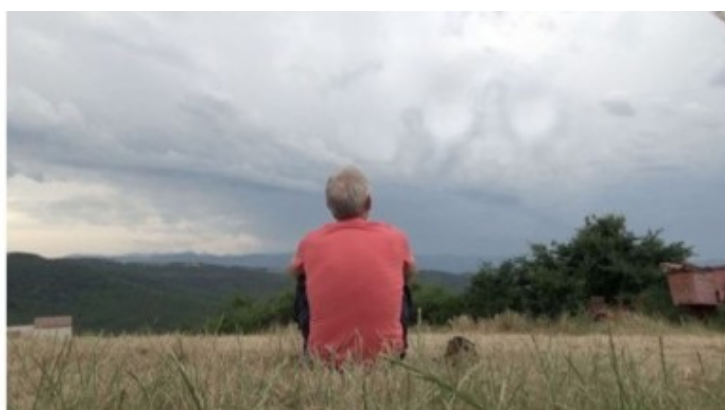
Fenêtres temporo-dimensionnelles ouvertes, observées par Jenaël et photographiées à Cassaignes - Aude (11)

Il existe donc des OVNI, c'est-à-dire des objets volants non identifiés, ou des phénomènes volants non identifiés, des phénomènes non volants, non identifiables et des phénomènes que certains