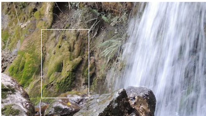
Photo prise à la cascade de Fourtou (11) où se révèle Cassiopée ailée en robe de plumes, tenant le miroir où apparaît le visage de sa contrepartie masculine