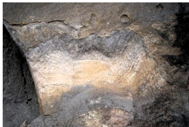
Un Urmah (humanoïde Léonin) avec son vaisseau "gigirlah", gravé dans un rocher sur un site celte, en forêt de Rennes-les-Bains (11).

Ces vaisseaux/OVNIs de 4 e densité fonctionnent avec des dispositifs antigravitationnels à "nucléofusion" qui font "chuter" un objet vers le haut, c'est-à-dire en l'air (dans le ciel), contrairement à la gravitation qui ferait tomber ce même objet au sol.