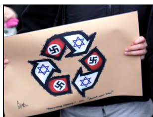
Logo di riciclaggio che compara il sionismo al nazismo nel corso di una manifestazione a Seattle, Stati Uniti, 2009

L'ideologia del sionismo scaturisce dai protocolli dei saggi di Sion che rivelano il progetto globale della cosiddetta avanguardia illuminata del ramo ariano : l'estrema destra ebraica.