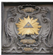
Catedral de Aix-La-Chapelle (Aquisgrán) de culto católico