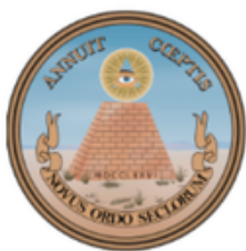
Reto del Gran Sello de los Estados Unidos