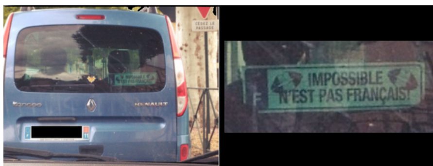
Impossible no es francés

Porque sólo hay una cosa que hace que un sueño sea imposible de cumplir: " ¡Es el miedo al fracaso! ", dijo Paulo Coelho.