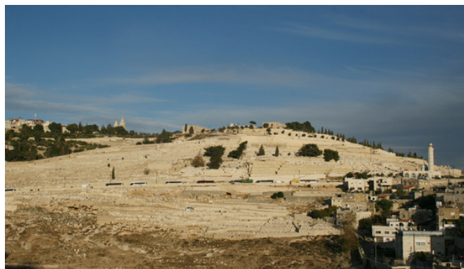
El Monte de los Olivos

Esta organización sionista mundial fue fundada en Basilea en 1897 y el primer gesto de los "Sabios de Sión" para la fundación de esta Tierra Santa fue de certificar con un símbolo de la resurrección del espíritu y de la lengua judía, sobre la Colina de Jerusalén, la supuesta tierra de los antepasados. Pusieron doce piedras para representar a las doce tribus de Israel.