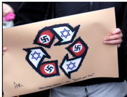
Logotipo de reciclaje compara el sionismo con el nazismo en una manifestación en Seattle, Estados Unidos, 2009

Este proyecto se llama hoy el Nuevo Orden Mundial (New World Order), que, tal como figura en los libros sagrados de las religiones abrahámicas, explica bien que toda la historia del mundo moderno debe terminar en Jerusalén.