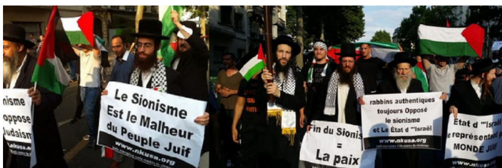
Pancarta durante una manifestación en San Francisco, Estados Unidos, 2003 “El sionismo es la desgracia del pueblo judío”

¿Hay que recordar también que fueron los extremistas sionistas arios, llamados judíos de pura raza, los que organizaron el holocausto de los judíos durante la Segunda Guerra Mundial?