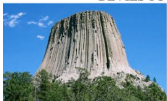
DEVILS TOWER - Wyoming

In alcune epoche la Terra ha accolto una realtà di gigantismo perché esistevano delle civiltà umane giganti, una vegetazione e animali titanici ( come i ceppi d’alberi fossilizzati – Devil Tower -, o i dinosauri Diplodocidae nel Wyoming).