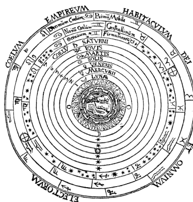
Schema huius præmissæ diuisionis Sphærarum.

Ciò che è stato accettato dalla teoria di Tolomeo è l’idea che la Terra, situata al centro dell’universo, è un oggetto immobile attorno al quale si muovono tutti gli altri oggetti come il Sole e i pianeti. Potrebbe essere vero, dato che la crosta terrestre gravita attorno al nucleo centrale che costituisce questo sole e che lo si può vedere nelle cinture di Van Allen. Per questo motivo questa teoria è stata interpretata come: geocentrismo.