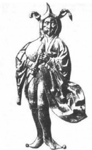
Dessin du Fou de Najera

"Dans le monastère de Santa Maria la Real de Najera à la Rioja en Espagne, figure une sculpture du XV e siècle représentant un Fou. [...] L'élément intéressant est que ce Fou est vêtu d'une robe évasée devant et derrière. Ainsi, ses parties génitales sont toujours exposées : ce Fou est nu. [Nous dirions même qu'il ne l'est qu'à moitié !]