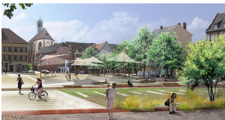
Reconstitution de la place de Saverne

En plein après midi, je me suis endormi dans mon lit pour une sieste, lorsque tout à coup je me retrouvai au milieu de la grand place de la ville de Saverne.