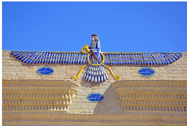
Zoroastre, le prophète fondateur d'une des premières religions monothéistes, chevauchant Nibiru

Mais de ce temps, un prophète Anunnaki nommé Zoroastre s'est levé contre ces superstitions, et les Aryens d'Iran/d'Irak devinrent monothéistes.