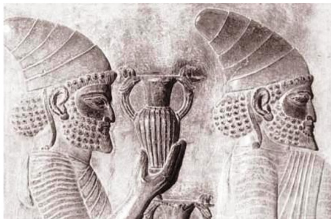
Les Aryens d'Iran sont les descendants hybrides des Anunnaki

Au milieu du VI e siècle av. J-C, ces ethnies aryennes s'allièrent afin de repousser les Sémites émigrés de l'Amenti huit siècles auparavant, et fondèrent un grand État qu'ils nommèrent Iran et Irak (Ir-An signifiant littéralement "le pays des Ir's (de ceux) d'AN", c'est-à-dire le pays des Aryens).